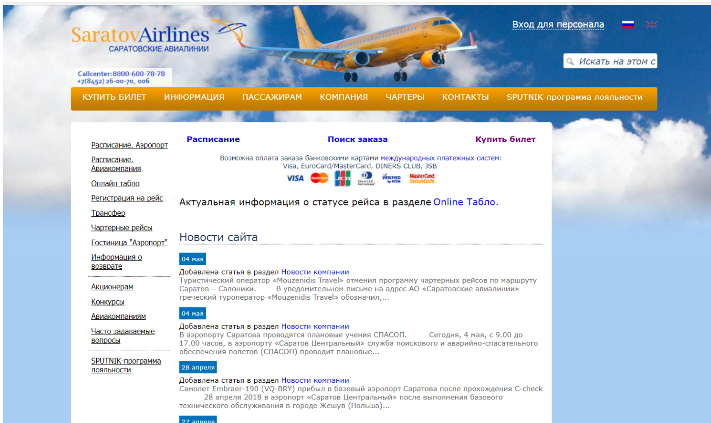
Рисунок 1. Сайт компании АО «Саратовские авиалинии»

В целом сегодня в интернете представлено много сайтов различных авиакомпаний, кроме того, существует множество агрегаторов, где можно купить необходимый билет на рейс.